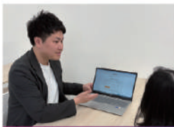
キャリアカウンセラー