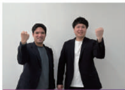
就職専任スタッフ